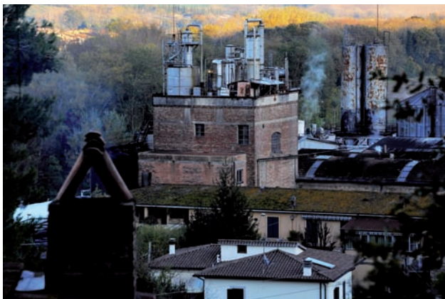
Fig. 2 Un sito industriale periurbano della valle del Tevere.