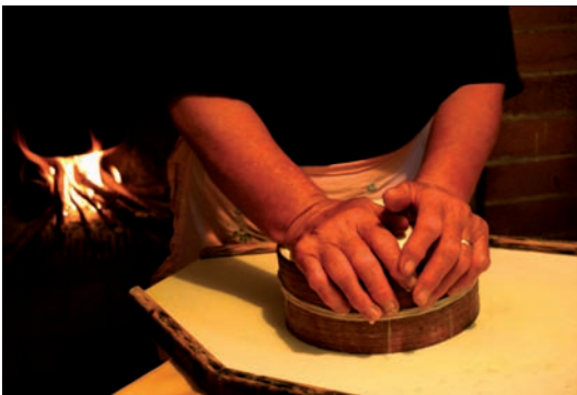
Fig. 7 Lavorazione del pecorino tradizionale in una casa di pastore, Sostino, Perugia.

“Sappiamo che si spreca approssimativamente un terzo degli alimenti che si producono, e il cibo che si butta via è come se lo si rubasse dalla mensa del povero” (n. 50).