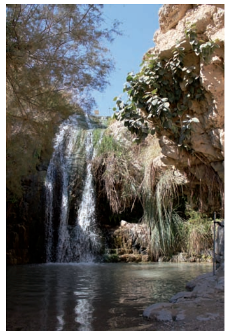
Fig. 5 Oasi di Ein Gedi, Deserto di Giuda, Israele.

Gli scarti della lavorazione del ferro (Fig. 4) ci ricordano che l'utilizzo delle risorse naturali, sia minerali che ambientali, finora condotto con criteri di sfruttamento, ha portato ad un esaurimento