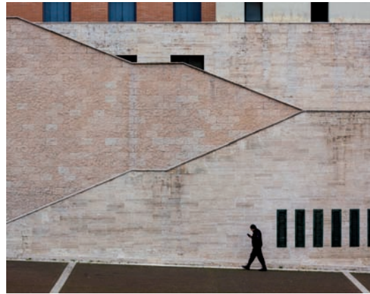
Fig. 6 Piazza del Bacio, Perugia.

La cementificazione di sempre più vaste aree sempre più densamente abitate (Fig. 6), allontana l'uomo, l'anziano, il bambino, dal contatto con la natura e i suoi ritmi. Per cercare il contatto che prima si trovava ogni sera davanti ad un focolare o tra i campi, bisogna affidarsi ai social network che ci rendono sempre più distanti. La tecnologia non viene più in nostro aiuto ma a questo punto diventa un ostacolo, tanto che nei sempre più frequenti casi patologici, la natura diventa un centro di recupero mentale. E' importante insegnare ai bambini esperienze nella natura, dove il rischio, il limite umano, i pericoli di forze superiori alle nostre siano ad essi ben presenti e si insegni a gestirli. Altrimenti, l'uomo diviene falsamente onnipotente, presumendo di poter governare e dominare la natura e i suoi ritmi, i suoi cicli, le sue ere. Il sisma non è che uno degli eventi che ci fanno capire, a volte gravemente e tristemente con sacrificio di vite umane, “chi ha ragione”.