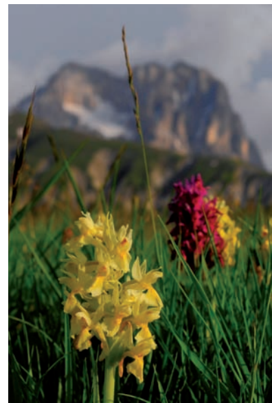
Fig. 1 Praterie con stupende fioriture di orchidee tutelate tra gli habitat in Direttiva 92/43/CE.

"Questa sorella protesta per il male che le provochiamo, a causa dell'uso irresponsabile e dell'abuso dei