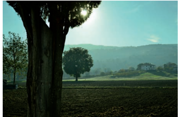
Fig. 3 Campagna di Bevagna, Perugia.

“Di fronte al deterioramento globale dell'ambiente, voglio rivolgermi a ogni persona che abita questo pianeta. In questa Enciclica, mi propongo specialmente di entrare in dialogo con tutti riguardo alla nostra casa comune” (n. 3). Un paesaggio comune in Centro Italia (Fig. 3) è stato scelto quale ambiente equilibrato tra la presenza umana e quella naturale, il terzo paesaggio, che ritorna a colonizzare piccoli lembi incolti; può essere riconosciuto come la nostra casa comune. Gli elementi del paesaggio delineano la presenza, insieme ad un gradevole esemplare in primo piano di Cupressus sempervirens (specie anticamente introdotta nei nostri ambienti), delle querce autoctone; il campo arato a seminativo e la casa rurale in collina, fanno riflettere sulle scelte che mettiamo in atto nella gestione paesaggistica, anche in relazione al consumo di suolo ed alle nuove emergenze ambientali: le specie alloctone invasive, le specie allergeniche, le specie con usi secondari alimentari, medicinali, melliferi, officinali. Dato che tutti coabitiamo, uomo compreso, nel nostro ambiente, le scelte dei progettisti devono sempre più essere messe in mano ad esperti competenti ed aggiornati sulla base degli avanzamenti della ricerca scientifica e nel rispetto reciproco della salute umana e della auto e sinecologia degli esseri viventi vegetali.