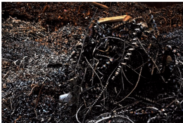
Fig. 4 Area industriale della periferia di Perugia.

delle stesse, non più in grado di ripristinarsi. Basti pensare al ritmo di consumo di suolo, o alla deforestazione. E' urgente ridurre i ritmi di sfruttamento delle risorse e ripartirle in modo equo nella società, in maniera da consentire la sostenibilità delle produzioni antropiche.