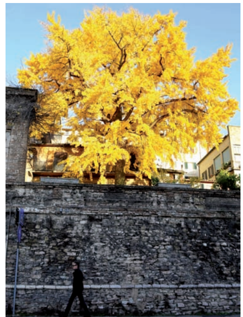
Fig. 10 Laudato si’: per non restare indifferenti.

La dottrina sociale della Chiesa propone, in linea con la agroecologia, una nuova ecologia integrale, dove tutto è connesso. Persone, animali, ambiente di vita. Diremmo la biocenosi, nel contesto ecologico dell’habitat Terra. Da questo scaturisce il ruolo sociale non solo dell’agricoltura, quale settore produttivo primario, ma anche del settore secondario e delle attività terziarie svolte in ambito naturale: servizi, biodidattica, ecoturismo, studio ed insegnamento, divulgazione. In questo senso, tutti coloro che lavorano e studiano nel campo dell’ecologia, tra cui i botanici, rivestono un ruolo importantissimo perché non si resti indifferenti davanti alle meraviglie con le quali i nostri occhi di studiosi hanno a che fare. Le forme di un fiore, le simmetrie, le storie di sopravvivenza ad ere biologiche, come il caso della specie Ginkgo biloba , ritratta in foto (Fig. 10). L’uomo della strada non passi oltre, ma sia istruito, su quanto deriva dalla creazione diretta, e su quanto l’uomo ha potuto fare per mantenere (quasi) intatta questa bellezza.