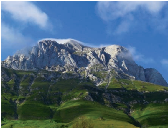
Fig. 9 Prati di Tivo, Pietracamela, Teramo.

“Tutto l’universo materiale è un linguaggio dell’amore di Dio, del suo affetto smisurato per noi. Suolo, acqua, montagne, tutto è carezza di Dio. La storia della propria amicizia con Dio si sviluppa sempre in uno spazio geografico che diventa un segno molto personale, e ognuno di noi conserva nella memoria luoghi il cui ricordo gli fa tanto bene” (n. 84).