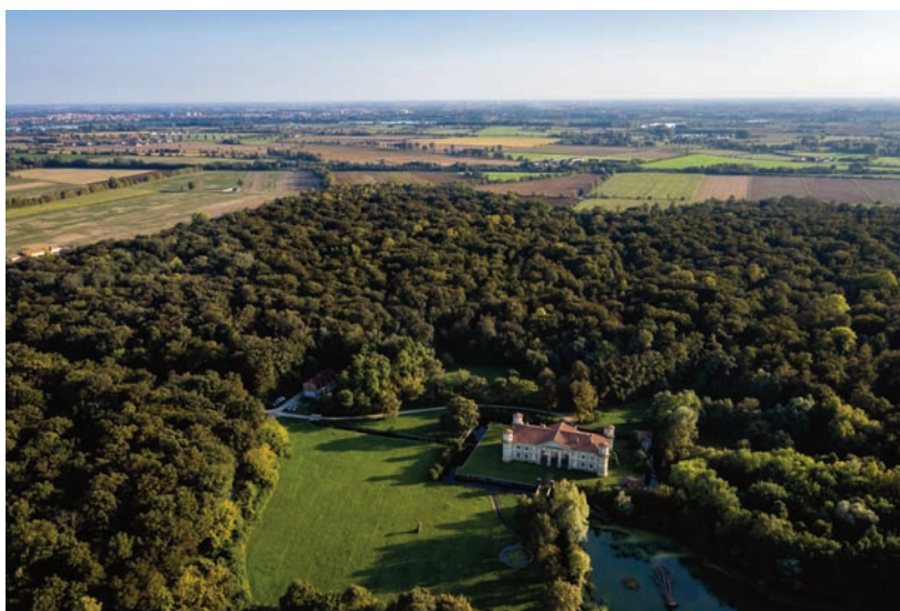
Fig.1 RNS Bosco Fontana (foto di Compagnia delle Foreste 2019).

Fino ad ora sono stati redatti tre inventari: il primo nel 1995, il secondo nel 2005 e il terzo nel 2016 (il quarto inventario è in corso), che, indagando la composizione dendrologica, ci permettono di trarre le prime conclusioni